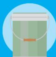
Secchi in plastica di varie dimensioni senza residui e sostanze pericolose