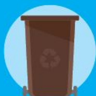
Cassonetti e bidoncini porta rifiuti