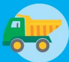
Giochi in plastica senza batterie

Se devi buttare uno di questi oggetti mettilo in questo contenitore.