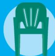
Tavoli, tavolini e sedie da giardino