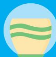
Vasi in plastica