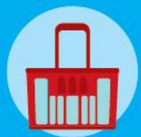
Casse porta bottiglie d'acqua