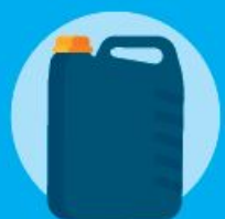
Tanichette, bidoncini, fusti senza residui e sostanze pericolose