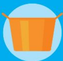
Bacinelle per il bucato, mastelli