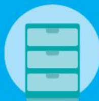
Componenti d'arredo, portaoggetti, fermacarte, etc