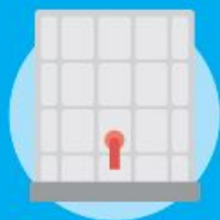
Cisterne da 500/1000 L senza metallo e bancale