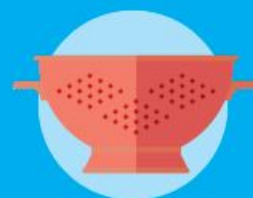
Articoli casalinghi in PP, scolapasta, mestoli, etc